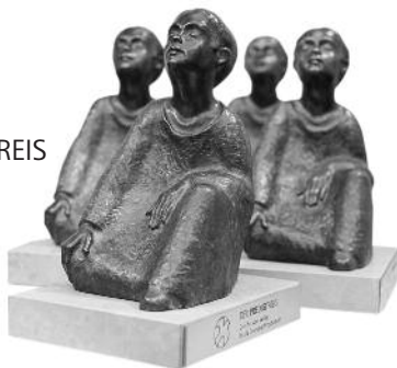
Die Auszeichnung des Predigtpreises „Sehnsucht nach Befreiung“