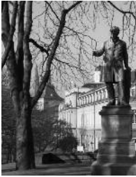
Arndt-Denkmal Alter Zoll

► Termine noch offen ab März 2012 Kurs-Nr. Z-29a