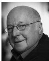
Dr. Norbert Blüm