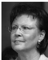
Heidemarie Wieczorek- Zeul

Die „Kanzelrede“ ist eine Sprachform, die zwischen der Predigt und dem Vortrag anzusiedeln ist. Sie legt einen biblischen Text aus und wird von der Kanzel gehalten. Menschen des „öffentlichen Lebens“ werden gebeten, einen Bibeltext ihrer Wahl aus ihrer persönlichen Perspektive zu beleuchten. Einen zweiten Schwerpunkt bildet die Kirchenmusik, die die Kanzelrede nicht nur rahmt, sondern eine alternative Form der Interpretation biblischer Texte bietet. Wir setzen die Veranstaltungsreihe, in der wir zuletzt den Direktor des Bonner Instituts zur Zukunft der Arbeit (IZA) und Präsidenten des Deutschen Instituts für Wirtschaftsforschung (Berlin) Prof. Dr. Klaus F. Zimmermann zu Gast hatten, im Frühjahr fort. Unsere nächsten Kanzelredner werden Bundesminister a.D. Dr. Norbert Blüm (22.01.12), der ehemalige Botschafter Israels in Deutschland Avi Primor (11.03.12) und Bundesministerin a.D. Heidemarie Wieczorek-Zeul (17.06.12) sein.