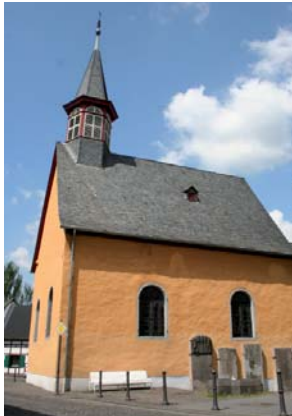
Von 1683: die alte und erste evangelische Kirche in unserer Region in Oberkassel

Der fachkundig geführte Weg bietet die Begegnung mit ausgewählten Kirchen in Bonn und seinen Bezirken. Start ist am Alten Zoll, dann geht es den Rhein hinauf zur traditionsreichen Rigal'schen Kapelle in Bad Godesberg. Von dort radelt die Tour – nach Rheinüberquerung per Fähre – zum mit Abstand ältesten protestantischen Gotteshaus in Bonn und der Region, der „alten evangelischen Kirche“ von 1683 in Oberkassel. Den ökumenischen Akzent zum Abschluss setzt die „Agia Trias“, die griechisch-orthodoxe Metropolitankathedrale in Beuel-Limperich mit ihren eindrucksvollen Ikonen.