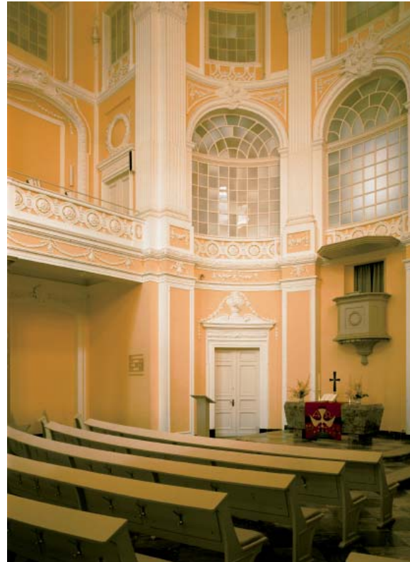
Einzigartig: Die evangelische Schlosskirche im Hauptgebäude der Bonner Universität, 1816 erste Gemeindegemeindekirche in Bonn