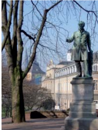
Denkmal von Ernst Moritz Arndt am Alten Zollufer in Bonn

7 € Erwachsene 5 € Ermäßigung für Schüler/Studierende 3 € Bonn-Ausweis